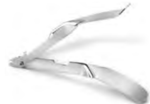
Leukosan® StapleRemover ist ein Hautklammerentferner