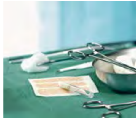
Verschließen, verheilen, vergessen.