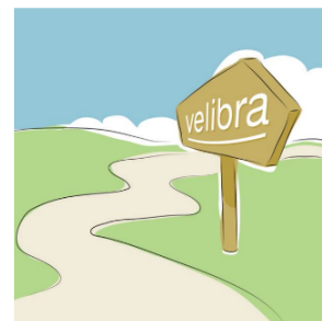
Was hat Sie heute zu mir geführt?

In diesem ersten Gespräch möchte ich Sie gerne etwas kennenlernen und auch etwas von mir erzählen.