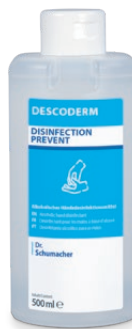
500 ml Spenderflasche