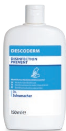
150 ml Kittelflasche