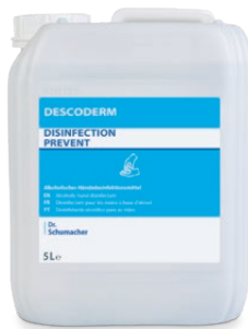
5 L Kanister

EBENFALLS UNERLÄSSLICH FÜR EINEN ERFOLGREICHEN INFEKTIONSSCHUTZ: REINIGUNG, PFLEGE UND SCHUTZ. EMPFOHLENE PRODUKTE AUS UNSERER ABGESTIMMTEN DESCOLIND SERIE