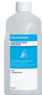
1 L Spenderflasche