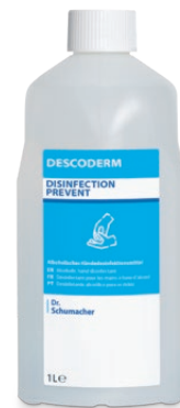
1 L Spenderflasche